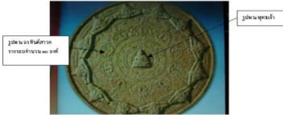
ภาพพระผดุมโซศ ปฐมอรหันต์ สุวรรณภูมิ(ด้านหน้า) มีรูปพระพุทธเจ้านั่งสมาธิอยู่ใจกลางองค์พระ ซึ่งหมายถึงพระพุทธศาสนา ได้เผยแผ่เข้ามายังดินแดนสุวรรณภูมิ ภาพประกอบจากหนังสือ มหาโพธิ์ ปีที่ ๒๗ เล่มที่ ๔๗๒ ประจำเดือนเมษายน ๒๕๕๐

ภาพด้านหน้าของวัดถุมนงคลรุ่นดังกล่าว มีรูปพระพุทธเจ้านั่งสมาธิอยู่ตรงกลางองค์ หมายถึง พระพุทธศาสนาได้เข้ามาเผยแผ่ในดินแดนสุวรรณภูมิแล้ว ตั้งแต่สมัยของพระเจ้า ทัพบไทยทอง ผู้ครองสุวรรณภูมิ ส่วนถัดมาในวงกลมก่อนวงรอบของพระราหู จะเห็นว่า มีรูปพระอรหันต์นั่งสมาธิรายรอบอีก จำนวน ๑๐ องค์ พระอรหันต์เหล่านี้ถือเป็นพระอรหันต์สาวกที่เกี่ยวข้องกับชาวสุวรรณภูมิ ล้วนมีชื่อปรากฏในกระเบื้องจารทั้งสิ้น ประกอบด้วย ๑๐