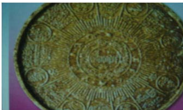
วัดถุมงคลรุ่น อุดมตชค ปฐมอรหันต์ สุวรรณภูมิ สร้างปี พ.ศ. ๒๕๔๗ ด้านหน้า (บน) ด้าน (ล่าง) ภาพประกอบจากหนังสือ มหาโพธิ์ ปีที่ ๒๗ เล่มที่ ๔๗๒ ประจำเดือนเมษายน ๒๕๕๐