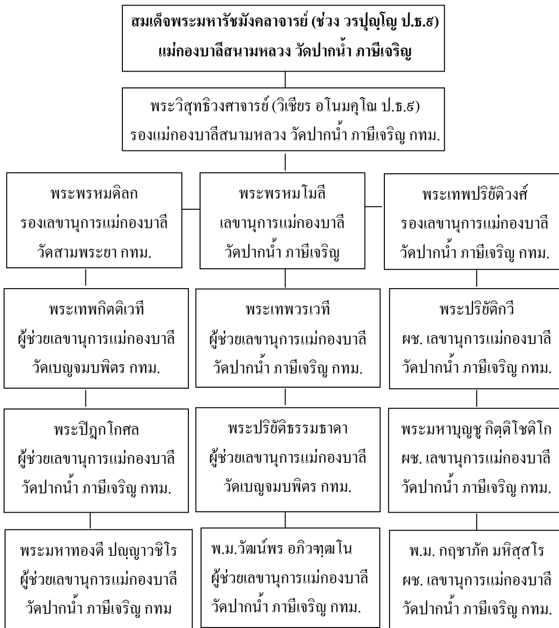
แผนภูมิที่ ๒.๑ แสดงโครงสร้างการบริหารของกองบาลีสนามหลวงในปัจจุบัน